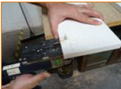
vyřezání vyznačených pozic na bočních dílech korpusu