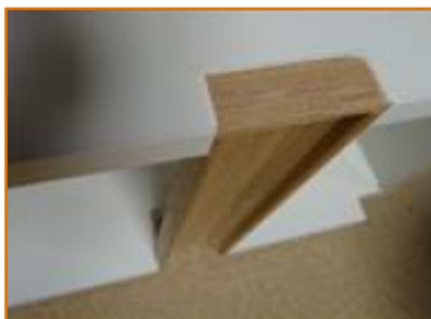
nalepení koncových krytek - vnější pohled