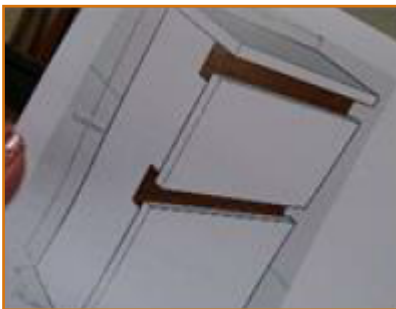
návrh nábytku s použitím dřevěné lišty na úchytky

Použití profilů L a C v dubovém provedení