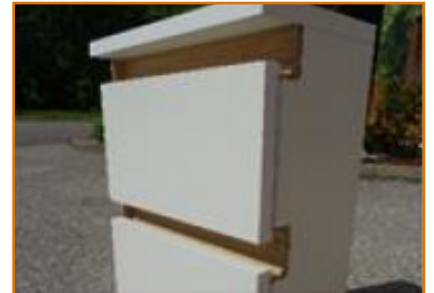
hotový korpus s úchytkami a s koncovými krytkami na jedné straně