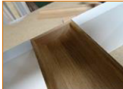
vnitřní pohled - lišta s koncovou krytkou