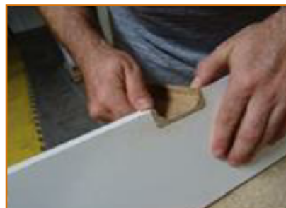
kontrola vyřezaného otvoru