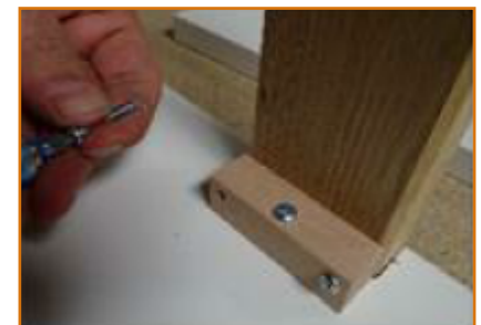
upevnění pomocí montážního příslušenství