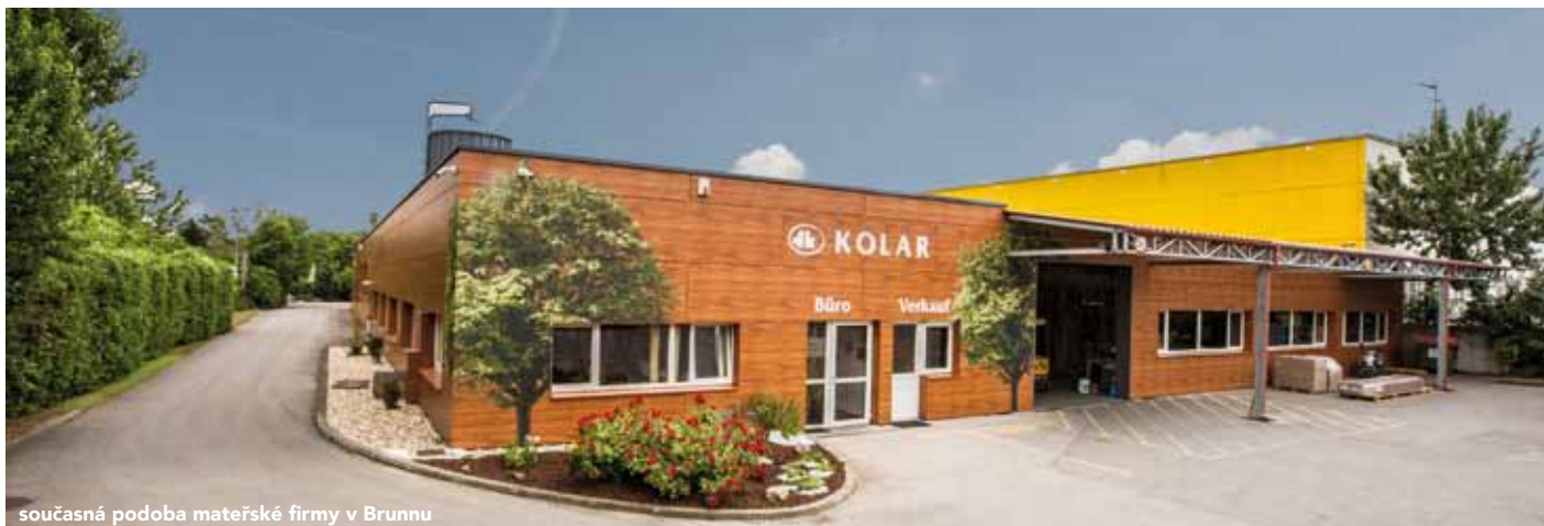
současná podoba mateřské firmy v Brunnu

2018. Za 90 let působení firmy na trhu v Rakousku resp. 25 let v Česku nabízíme našim zákazníkům nejenom lišty, ale také ucelený program madel vč. příslušenství, designové a obkladové panely, větrací a ozdobné mřížky, rámy, oblouky, výrobu na zakázku.