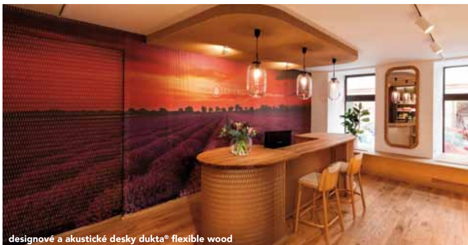
designové a akustické desky dukta® flexible wood