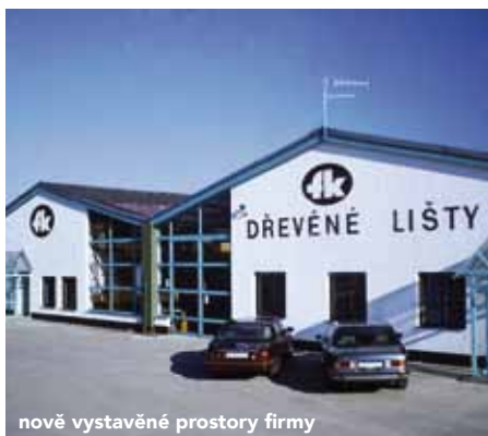
nově vystavěné prostory firmy