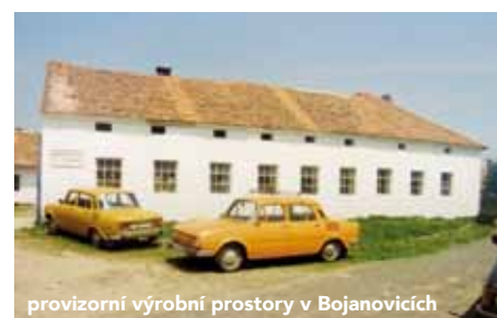
provizorní výrobní prostory v Bojanovicích

1994 byla do zkušebního provozu uvedena nově postavená lakovna, truhlárna a výrobní lišt. K úspěšné kolaudaci došlo v dubnu téhož roku. Původní provoz tak mohl být přestěhován do nových prostor. V dalším budování se pokračovalo. Byla postavena sušárna dřeva a skladovací hala na řezivo. 9. září 1994 - oficiální otevření firmy v místech, kde ji známe dnes. Začaly se budovat skladovací prostory hotových výrobků, rozšiřovala se expedice a další sušárny dřeva.