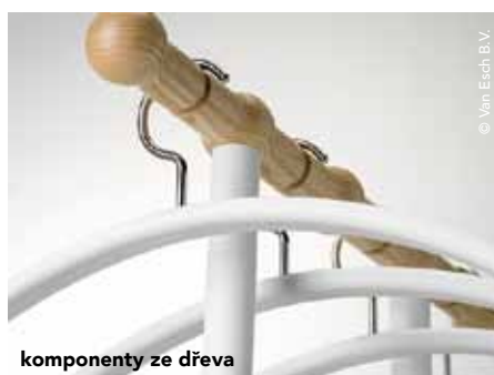
komponenty ze dřeva