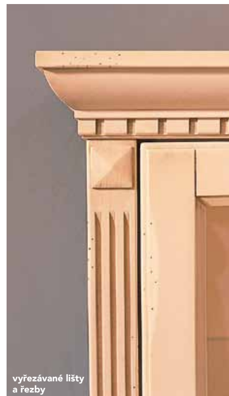
vyřezávané lišty a řezby