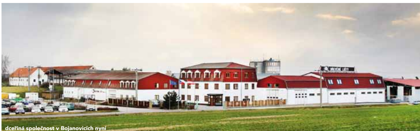
dceřiná společnost v Bojanovicích nyní