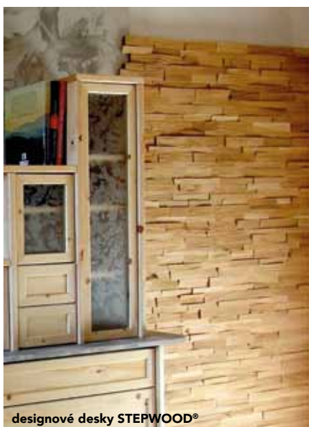
designové desky STEPWOOD®