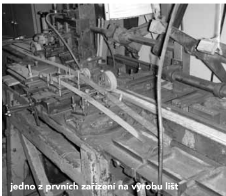
jedno z prvních zařízení na výrobu lišt

První vyřezávací stroj měl dřevěnou konstrukci s pohonem na jeden motor, tento sloužil současně pro posuv i pro vyřezávací agregáty. Dokončení stroje v roce 1928 bylo podnětem k založení společnosti Franz Kolar ve Vídni , kde pan Kolář pracoval společně se svými třemi dětmi.