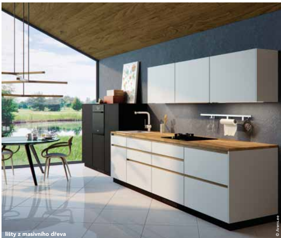
lišty z masivního dřeva