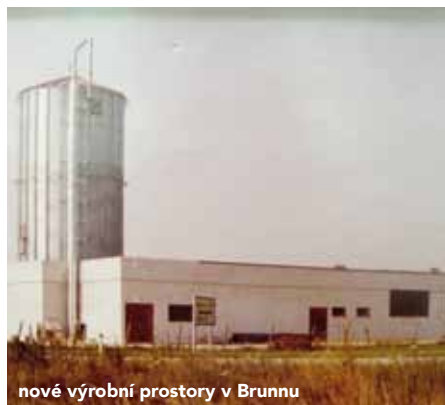
nové výrobní prostory v Brunnu

Už tenkrát vyžadoval trh od výrobců stále