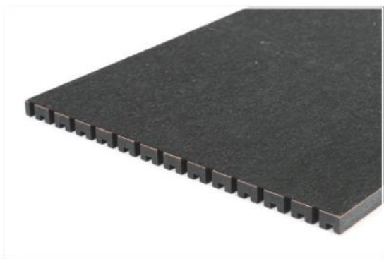
Akustický vlies na spodní straně.

Pozn.: V případě barevného lakování na pohledové straně je zadní strana desek lakována bezbarvým lakem. U typu frézování JANUS : +50 % za oboustranně pohledovou PÚ.