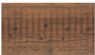
dřevo – šedá