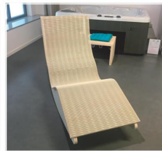
Použití: lehátko Dřevina: osika