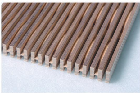
dukta ® LINAR v provedení deska saunaboard s ořechovou dýhou (pohledová strana)