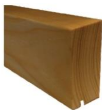
montážní lišta smrk 50 x 20 mm