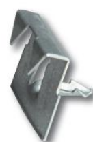
ukončovací spona 3 ks