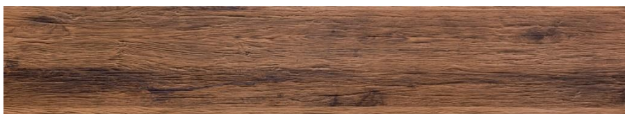
dub sluncem pálený

Pro rychlou a snadnou instalaci (obložení stěn) lze použít náš montážní materiál Stepwood®, sestávající se z montážních lišt a sady upevňovacích spon viz zadní strana.