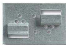
průběžná spona (vč. hřebíků) dřevěná vodící lišta (10 mm) 20 ks + 10 ks